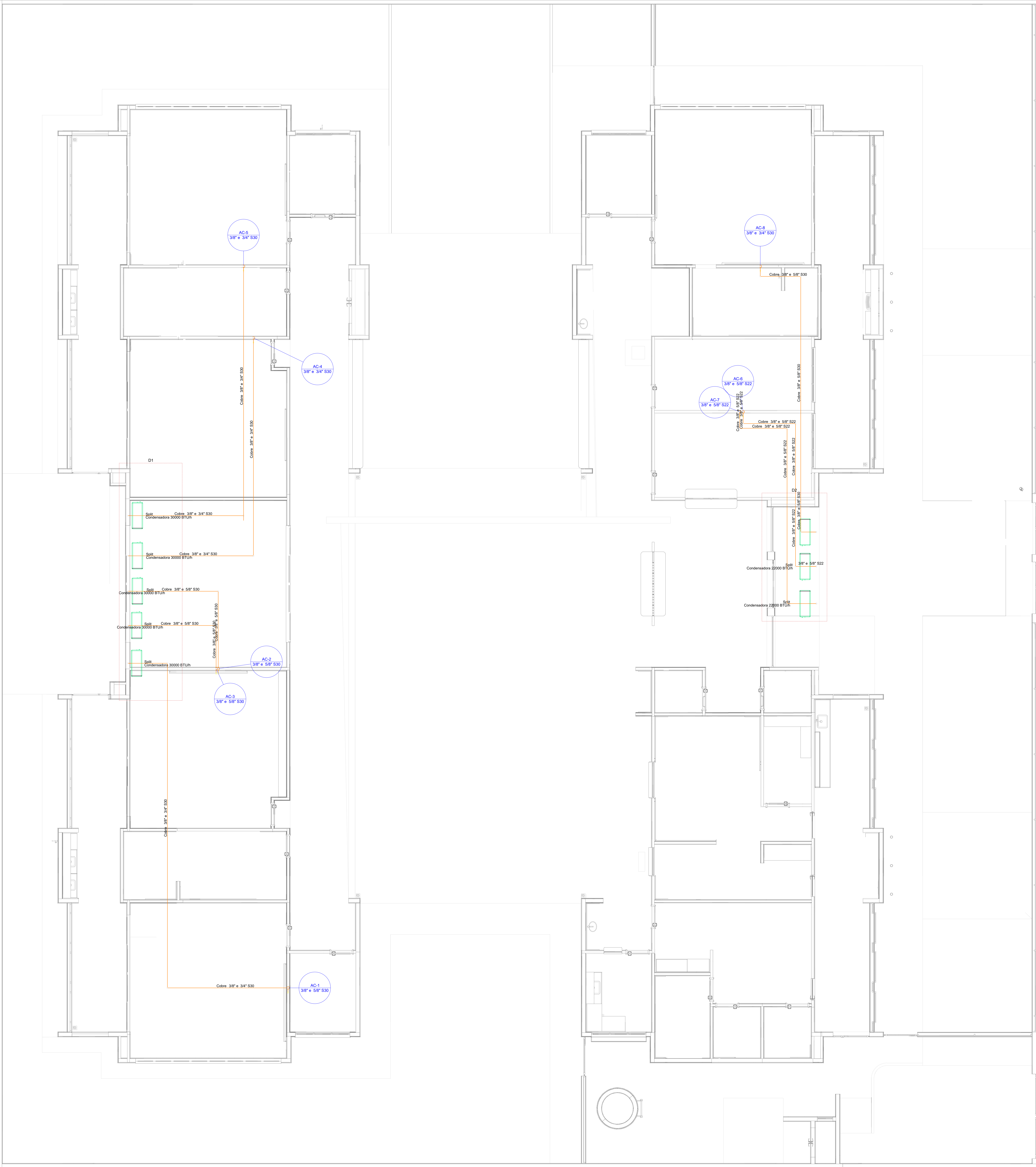
3 PLANTA BAIXA COBERTURA ESCALA 1/50